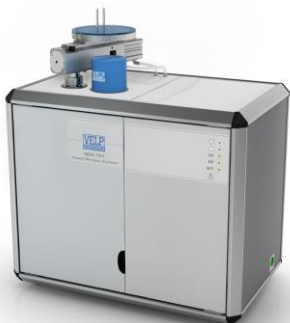
燃焼式窒素/タンパク分析装置 NDA701